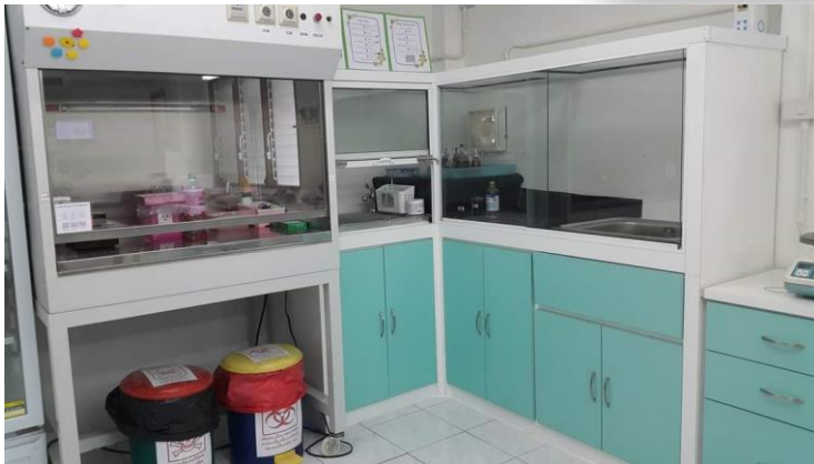
งานจุลชีววิทยาคลินิก