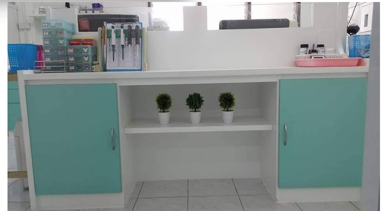
งานธนาคารเลือด