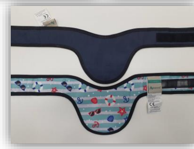
อุปกรณ์ป้องกันอันตรายจากรังสี