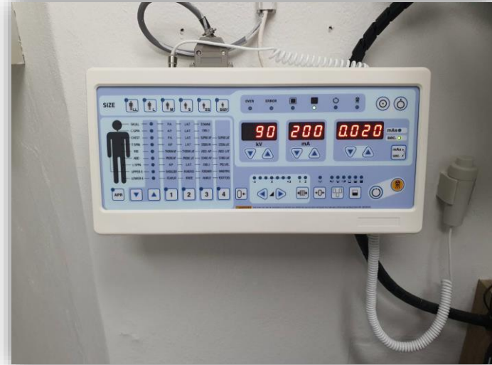
เครื่องเอกซเรย์ ยี่ห้อ SITEC รุ่น EcoRAD (DigiRad-401S)