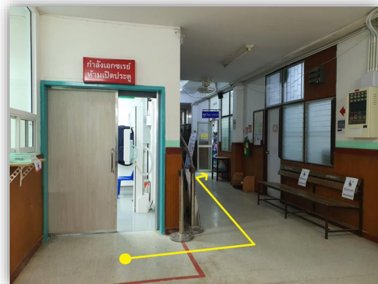
ระยะทางระหว่างห้องปฏิบัติการฯและแผนกฉุกเฉิน 5 เมตร