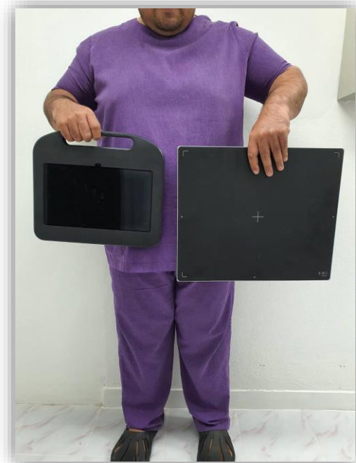
อุปกรณ์สร้างภาพในระบบดิจิทัล Digital Radiography (DR)