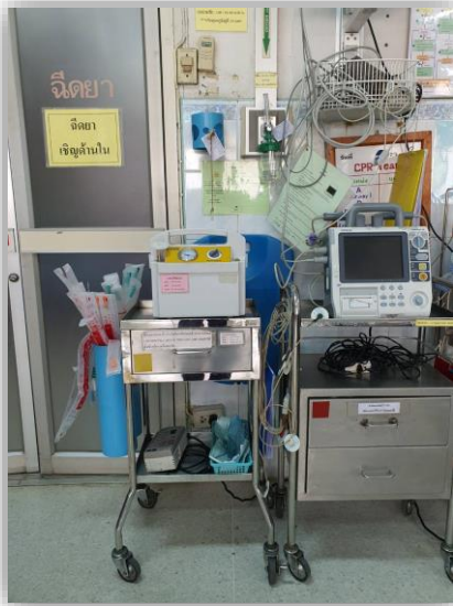
เครื่องดูดเสมหะ และระบบออกซิเจนไปป์ไลน์ภายใน ห้องฉุกเฉิน จุดประตูฝั่งห้องเอกซเรย์