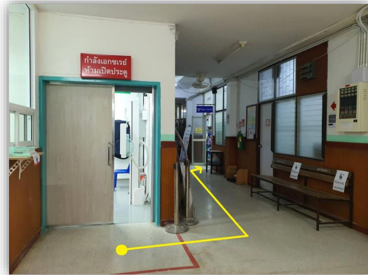
ระยะทางระหว่างห้องปฏิบัติการฯและแผนกฉุกเฉิน 5 เมตร