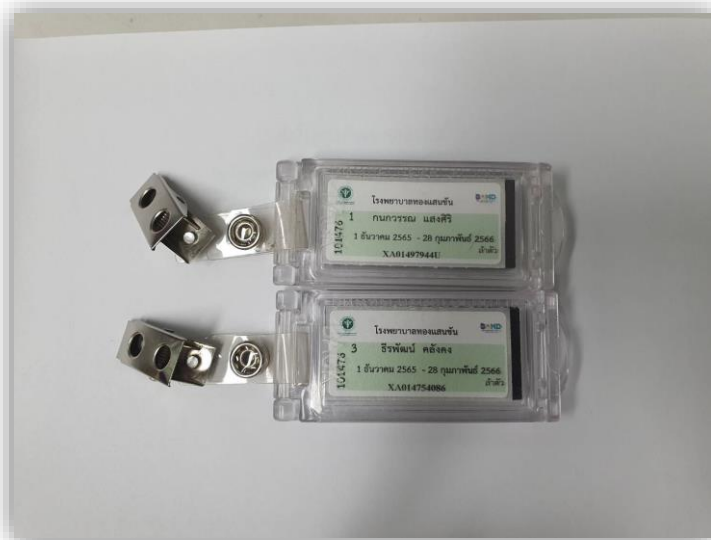
แผ่นวัดปริมาณรังสีส่วนบุคคล OSL