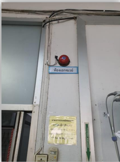
เครื่องส่งสัญญาณกดจากห้องปฏิบัติการฯ ส่งสัญญาณไปที่แผนกฉุกเฉิน