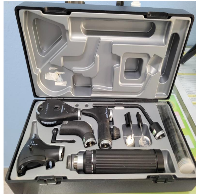
ชุดตรวจเฉพาะทาง (ตรวจหูดตา)