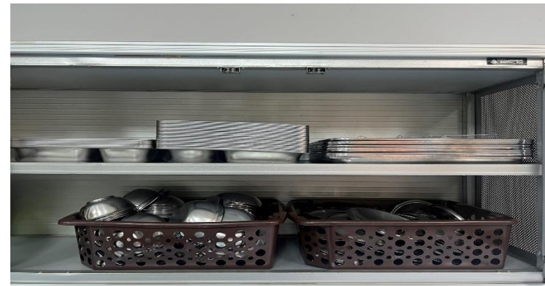
อุปกรณ์ เครื่องมือ เครื่องใช้ในการประกอบ อาหารและจัดส่งอาหารที่ถูกสุขลักษณะ