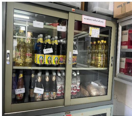
ตู้เก็บอาหารที่สะอาดและมีฉลาก