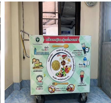
รถเข็นอาหารผู้ป่วย