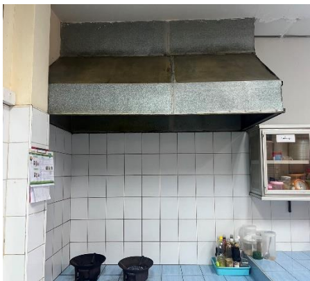
อุปกรณ์ระบายอากาศ เครื่องดูดควัน