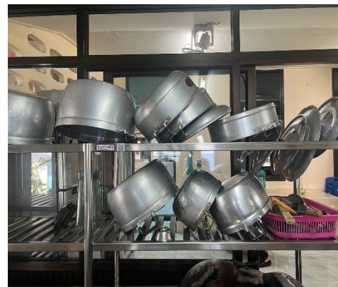
อุปกรณ์ภาชนะประกอบอาหารผู้ป่วย