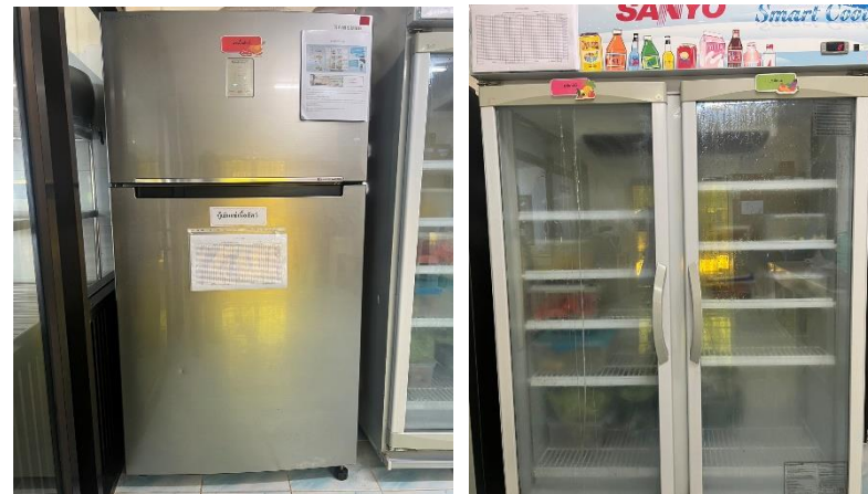
ตู้เก็บเนื้อสัตว์ ผัก ผลไม้