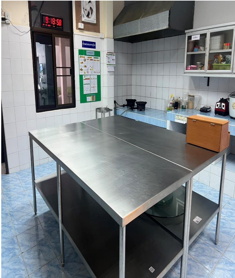
โต๊ะเตรียมอาหารที่สะอาด