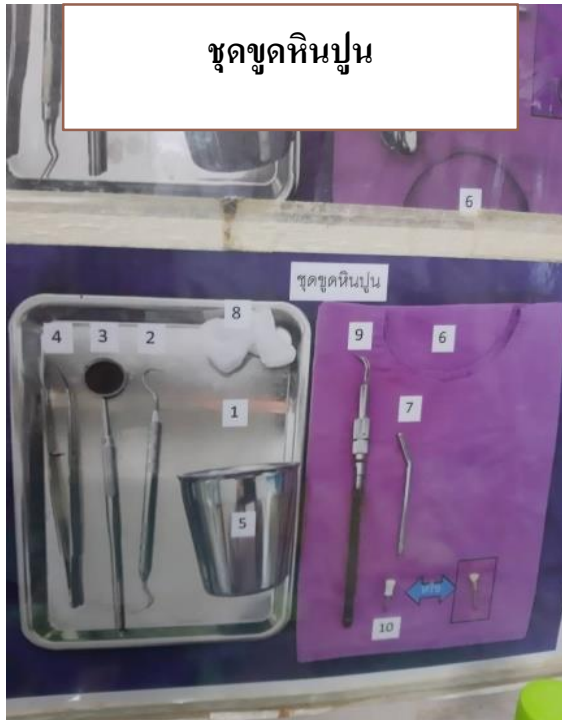
ชุดชุดหินปูน