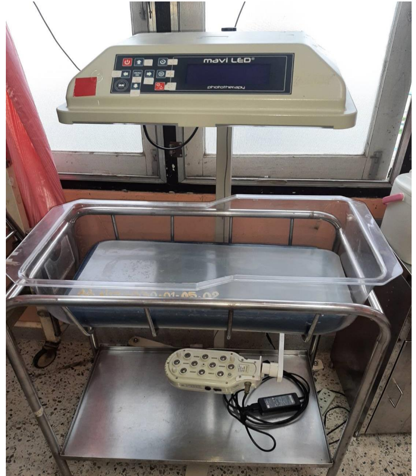
เครื่องรักษาทารกตัวเหลือง