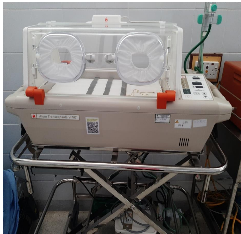
ตู้อบทารกคลอดก่อนกำหนด