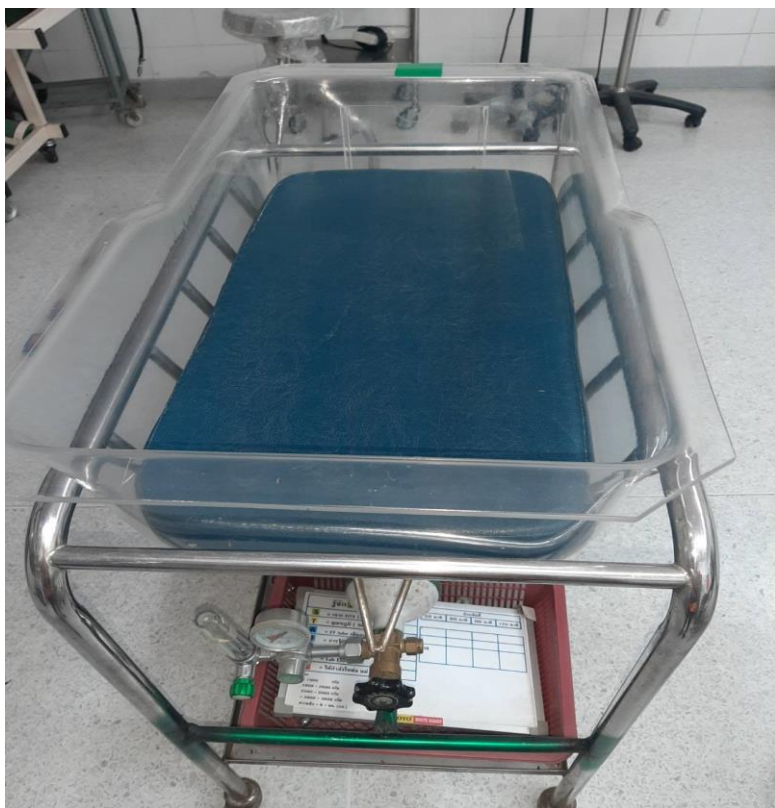
เตียงทารกหลังคลอด