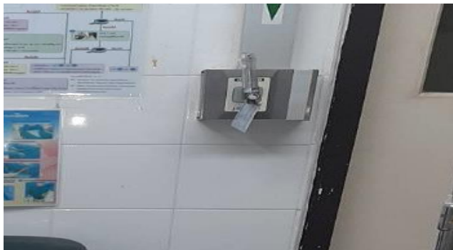
ระบบก๊าซทางการแพทย์