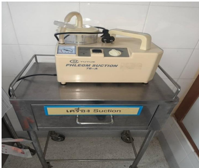
เครื่องดูดเสมหะ