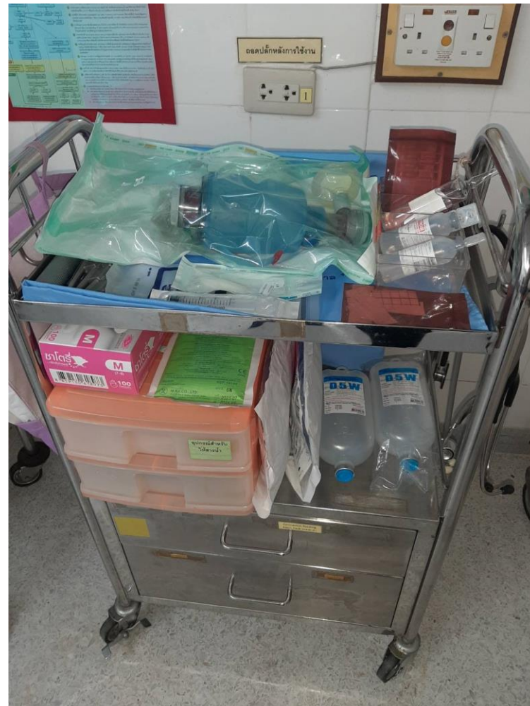
ชุดอุปกรณ์ช่วยฟื้นคืนชีพ