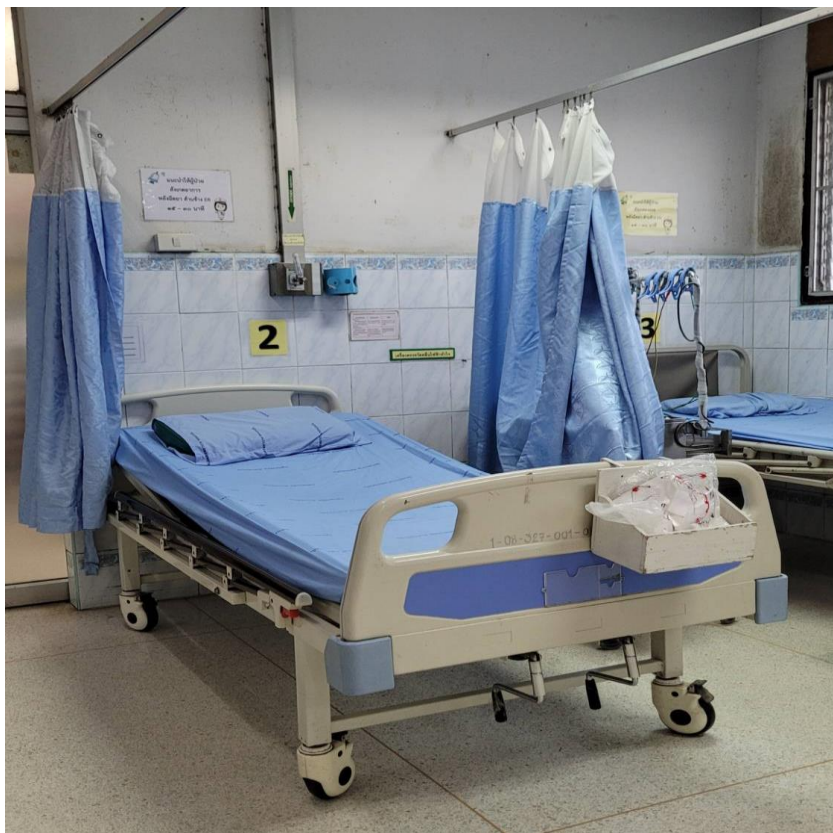
เตียงฉีดยา