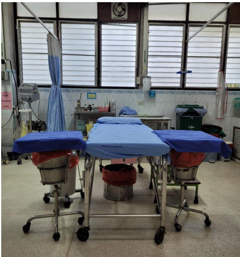
เตียงทำแผล เย็บแผล

ผู้ป่วยนอกให้การรักษาที่ห้องฉุกเฉิน ซึ่งมีอุปกรณ์พร้อมให้บริการดังนี้