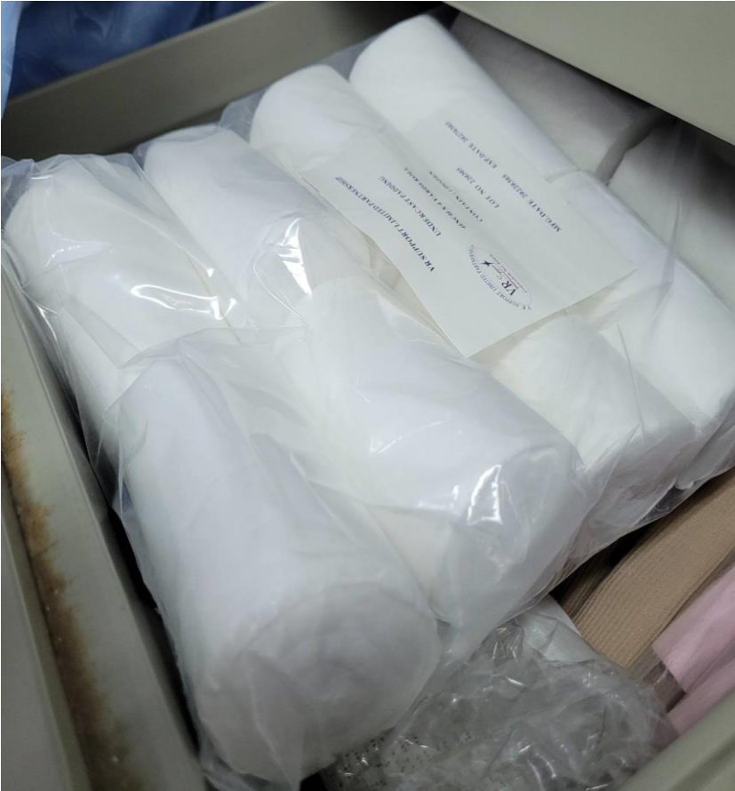
สำลีรองเฟือก