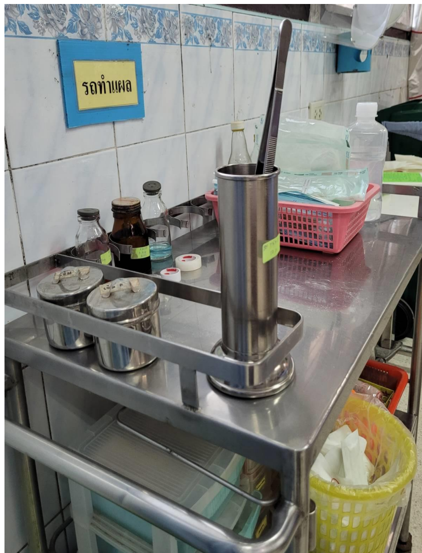
รถอุปกรณ์ทำแผล