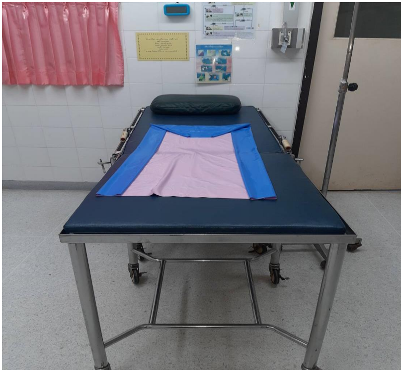
เตียงทำคลอด