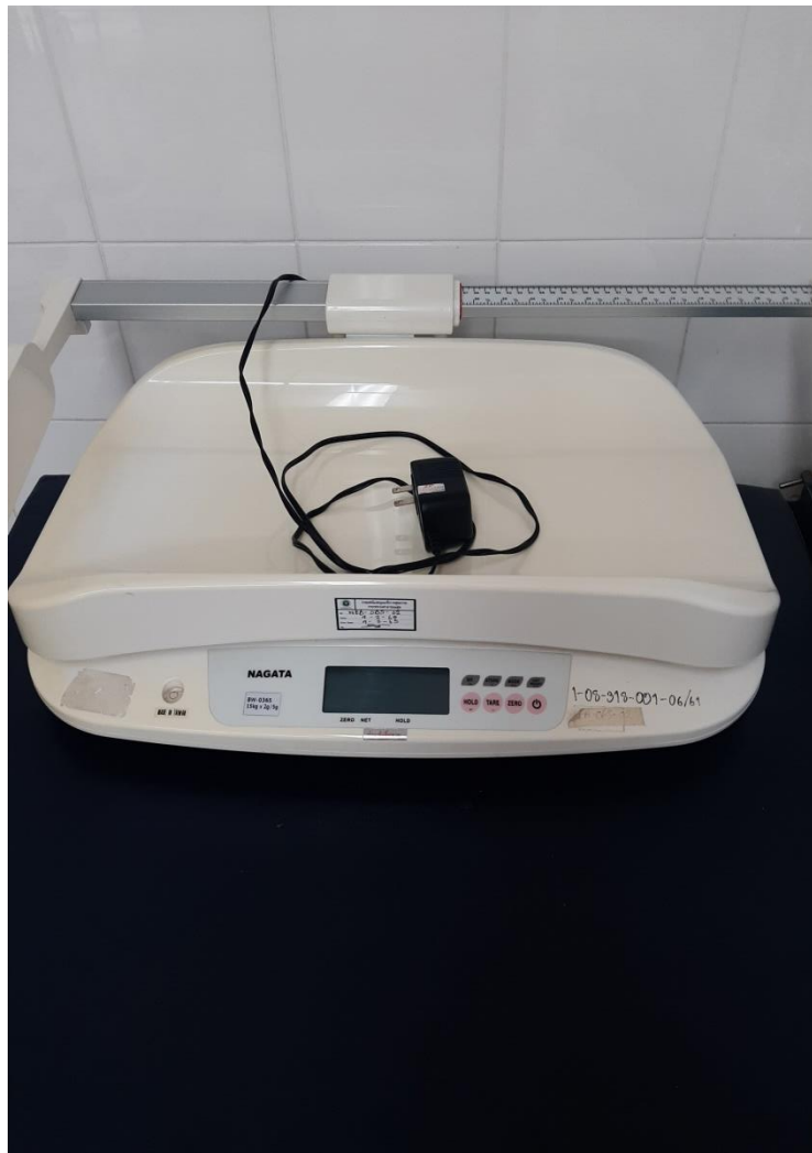
เครื่องชั่งน้ำหนักทารก