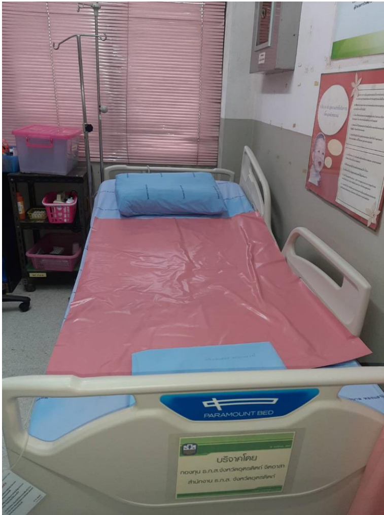
เตียงรอกคลอด