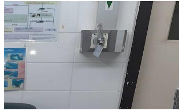
ระบบก๊าซทางการแพทย์