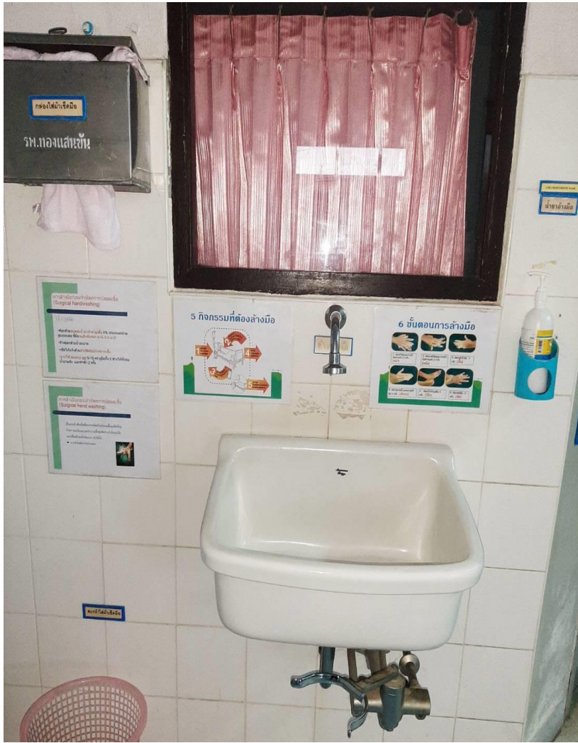
อ่างฟอกมือ