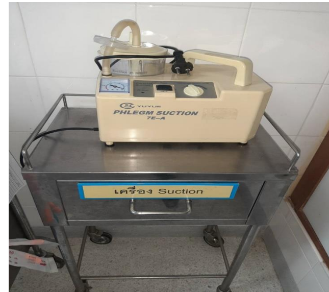
เครื่องดูดเสมหะ