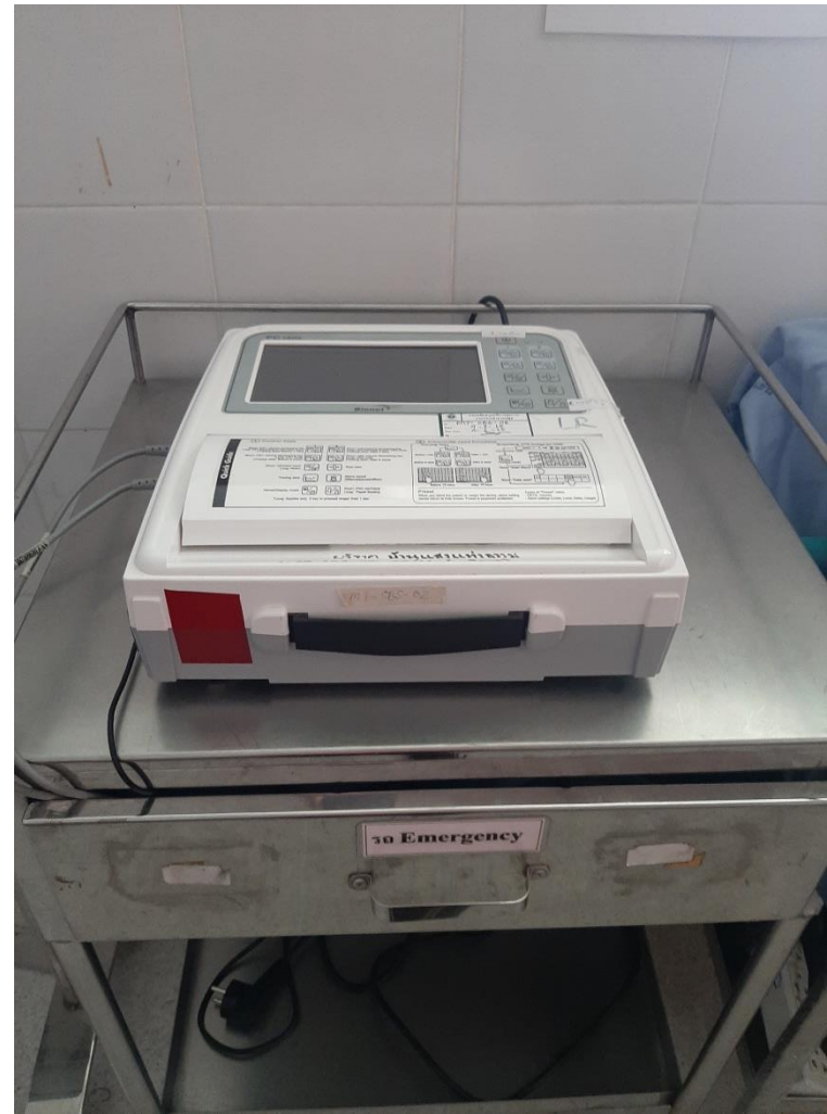
เครื่องตรวจสัญญาณชีพทารก(NST)