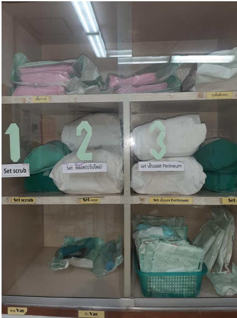
เครื่องมือทำคลอด