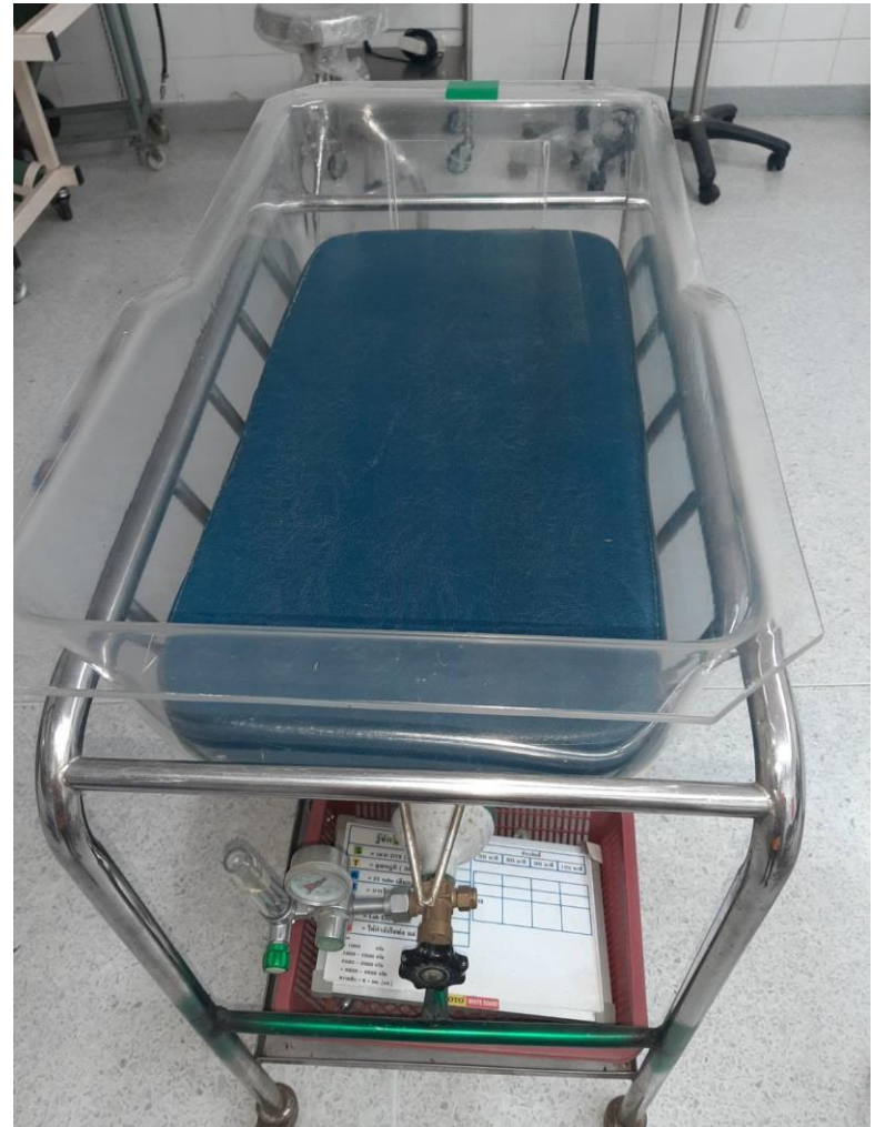
เตียงทารกแรกเกิด