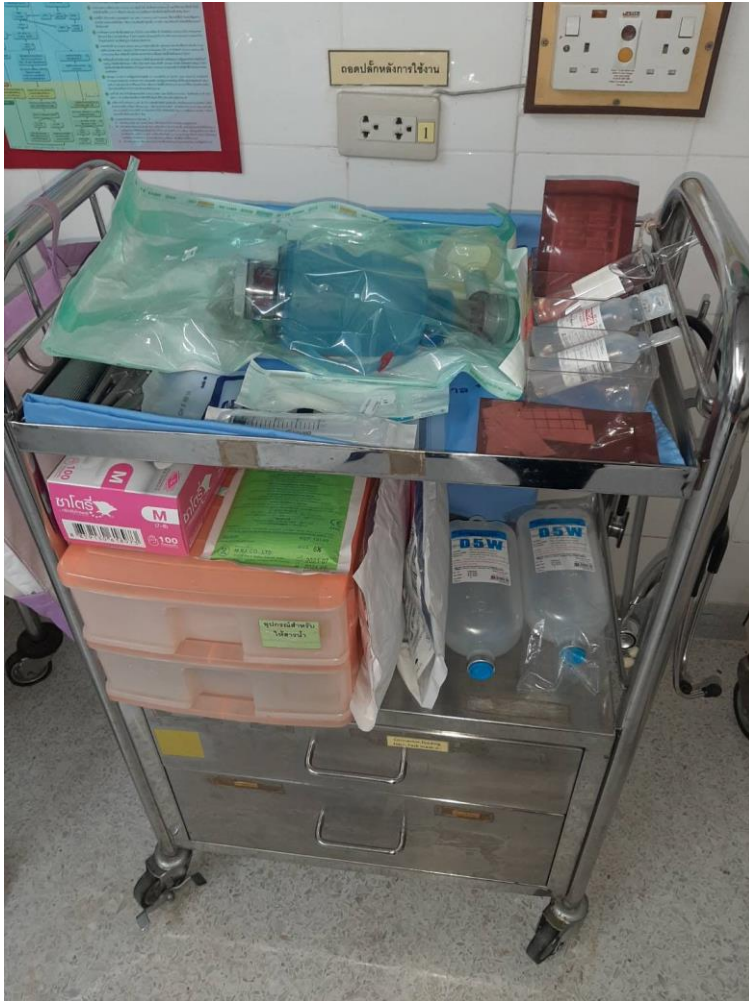
ชุดอุปกรณ์ช่วยฟื้นคืนชีพ